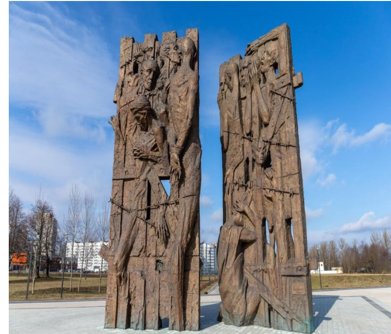
Мемориальный комплекс «Тростенец» в Минске с 10-метровым центральным монументом «Врата памяти»