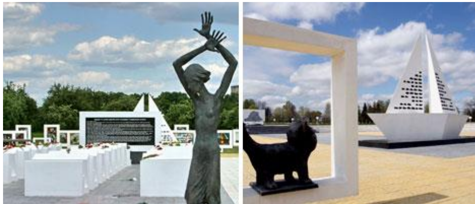
Мемориальный комплекс «Детям – жертвам войны» (Гомельская область, Жлобинский район, д. Красный Берег)