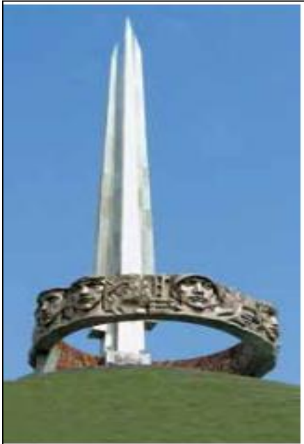
Курган Славы Советской Армии — освободительницы Беларуси.