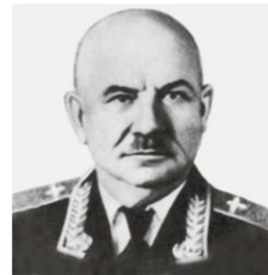
Степан Акимович Красовский (1897—1983)

Маршал авиации, Герой Советского Союза. Участник Гражданской и советско-финляндской войн. В Великую Отечественную войну на Южном, Брянском, Юго-Западном, Воронежском и 1-м Украинском фронтах: командующий ВВС 56-й армии, Брянского и Юго-Западного фронтов, 2-й и 17-й воздушными армиями. Участвовал в Сталинградской и Курской битвах, в освобождении Украины, Польши и других боевых операциях. Отличился умелым командованием авиацией и организацией ее взаимодействия с наземными войсками. После войны на руководящих постах в ВВС СССР.