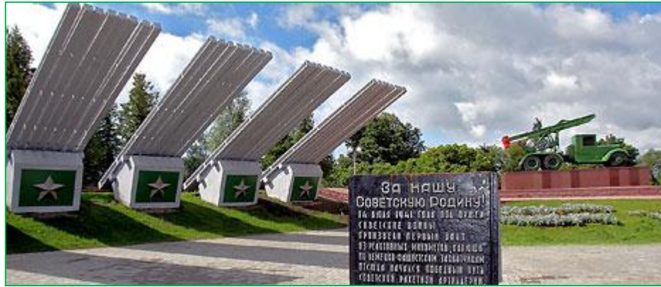
На берегу Днепра в Орше мемориальный комплекс "Катюша" ("За нашу советскую родину!")