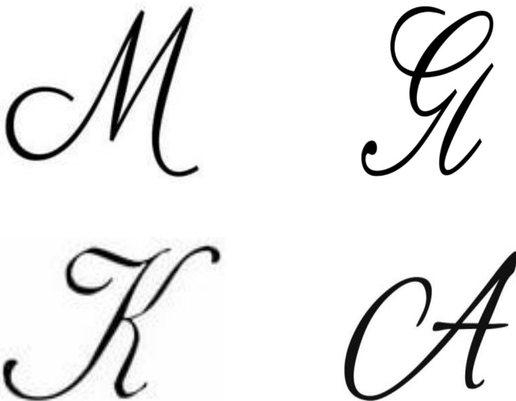
Рисунок 3. Варианты букв для вышивки