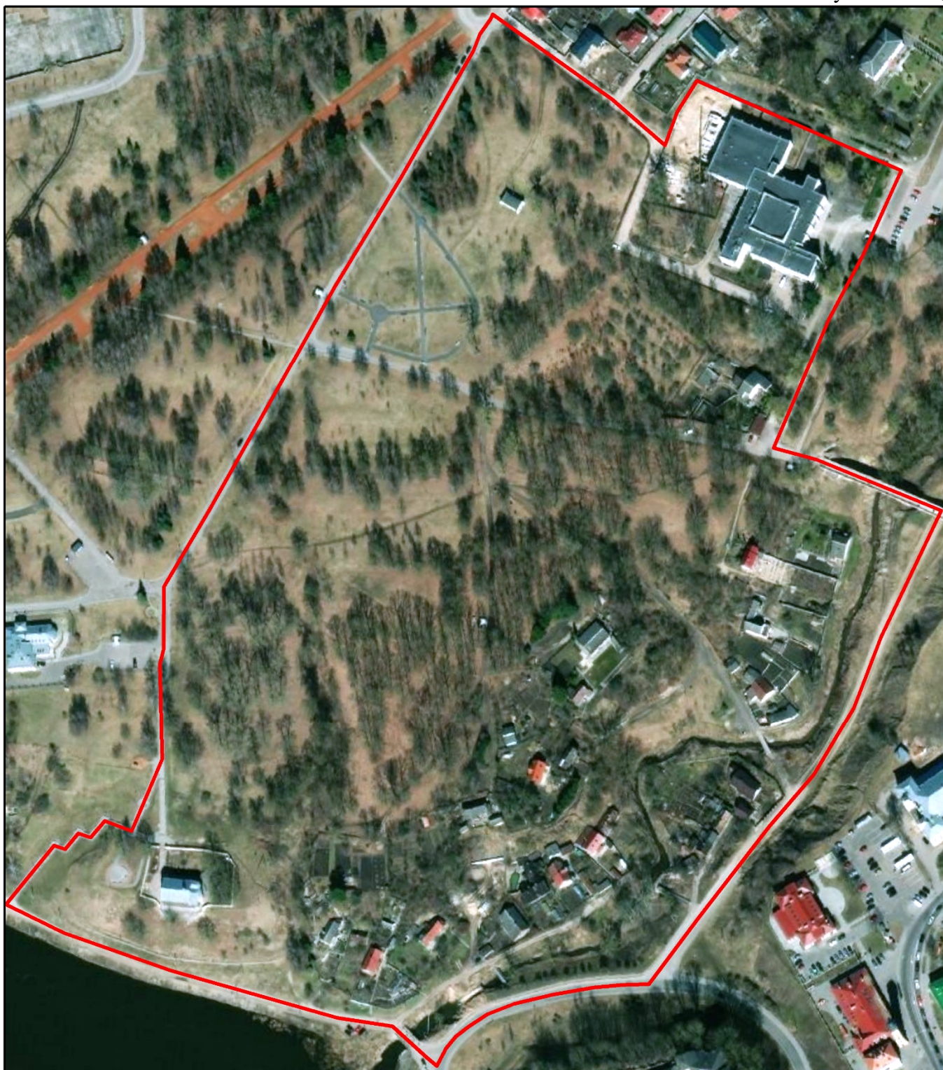
Рисунок 1. Космический снимок участка в г. Гродно (съемка местности 2020 г.)