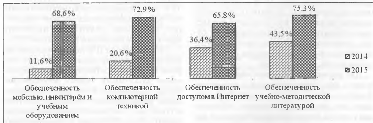
Диаграмма 2 — Динамика оценки «выше среднего» обеспеченности учреждения различными видами ресурсов (работники АУП)