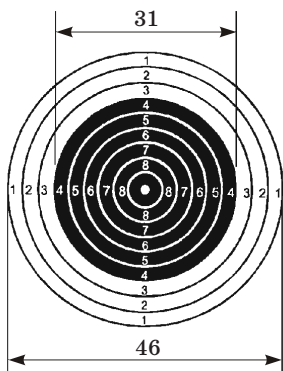
Мишень № 8. Размеры даны в мм