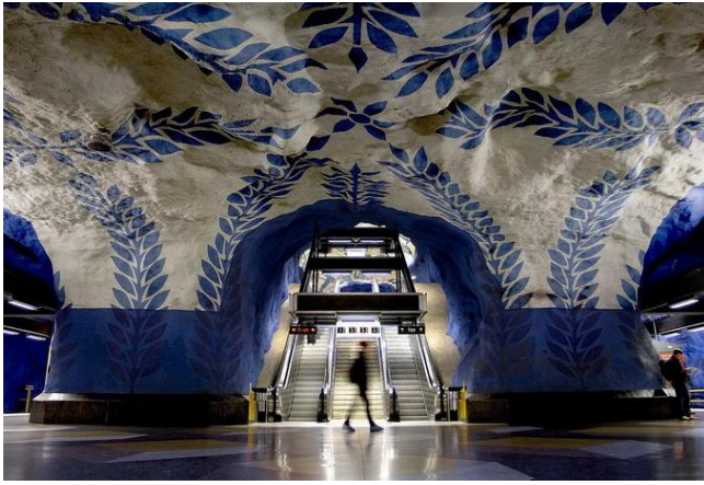
Стокгольм. «Т-Централен» (T-Centralen)