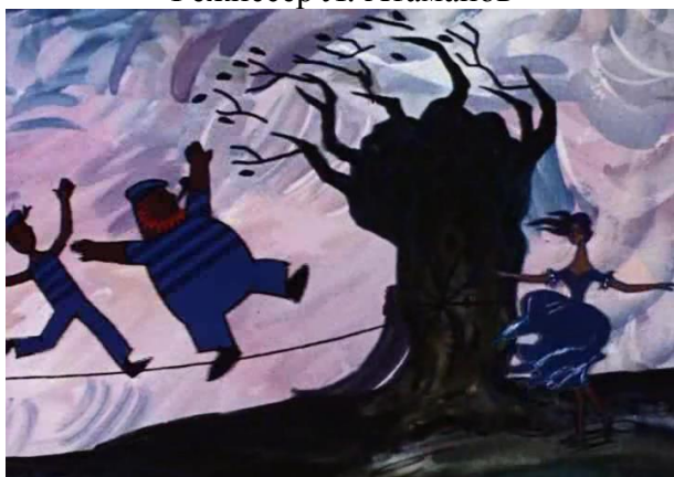
Кадр из фильма «Балерина на корабле». Режиссер Л. Атаманов