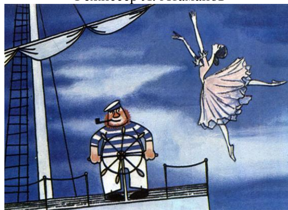
Кадр из фильма «Балерина на корабле». Режиссер Л. Атаманов