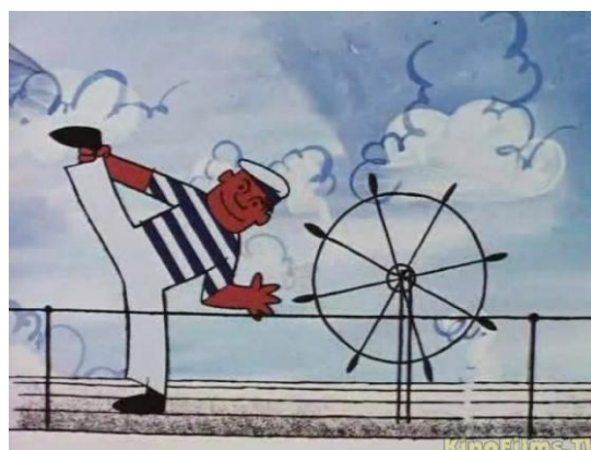
Кадр из фильма «Балерина на корабле». Режиссер Л. Атаманов