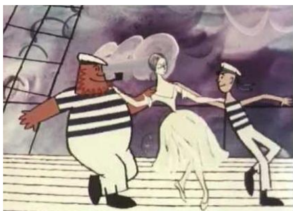
Кадр из фильма «Балерина на корабле». Режиссер Л. Атаманов

Посмотрите внимательно мультфильм Льва Атаманова «Балерина на корабле». Перечислите всех танцующих на корабле. Чем отличаются их танцы?