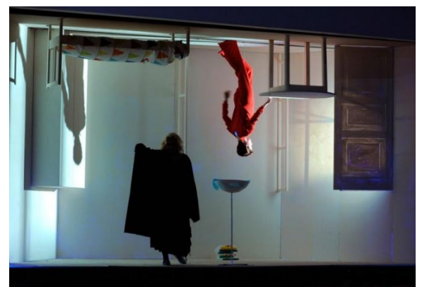
Сцены из спектакля «Любовь к трём апельсинам». Музыкальный детский театр им. Н.И. Сац