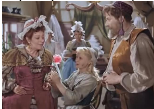
Кадр из х/ф «Золушка», реж. Н.Н. Кошеверова

Представьте, что вы – актёры. Вам необходимо произнести слова с интонацией, прома противоположной их значению. Но так убедительно, как это сделали выдающиеся актёры в фильме «Золушка». Например, выражение «стоит прекрасная погода» нужно произнести с интонацией недовольства, неприязни. А слова «на улице ужасная погода» – с выражением восхищения, радости и удовольствия.