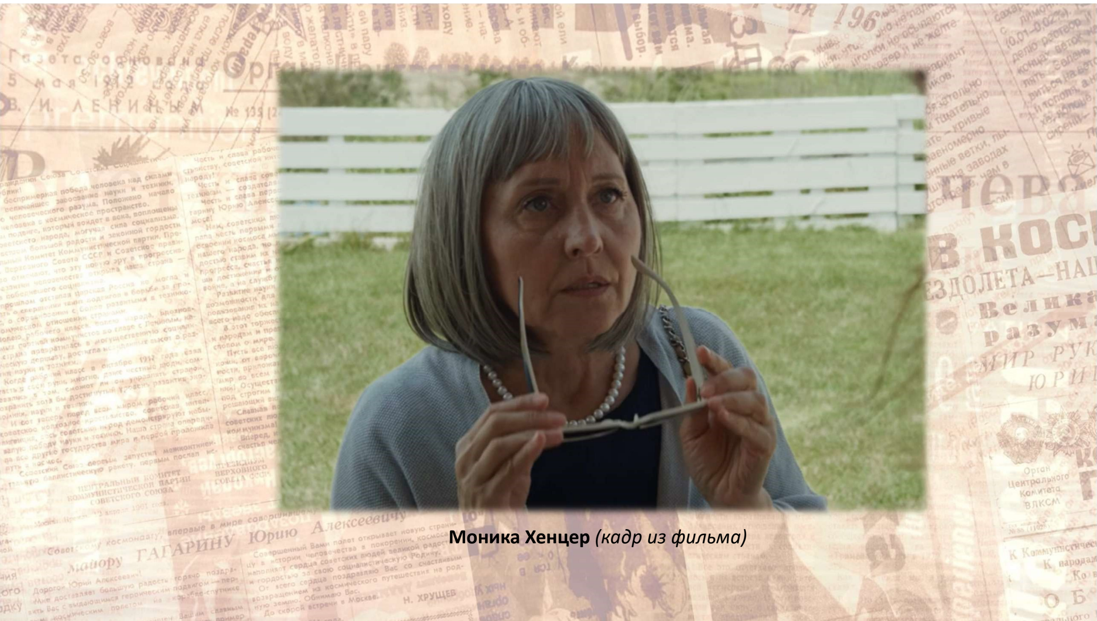
Моника Хенцер (кадр из фильма)