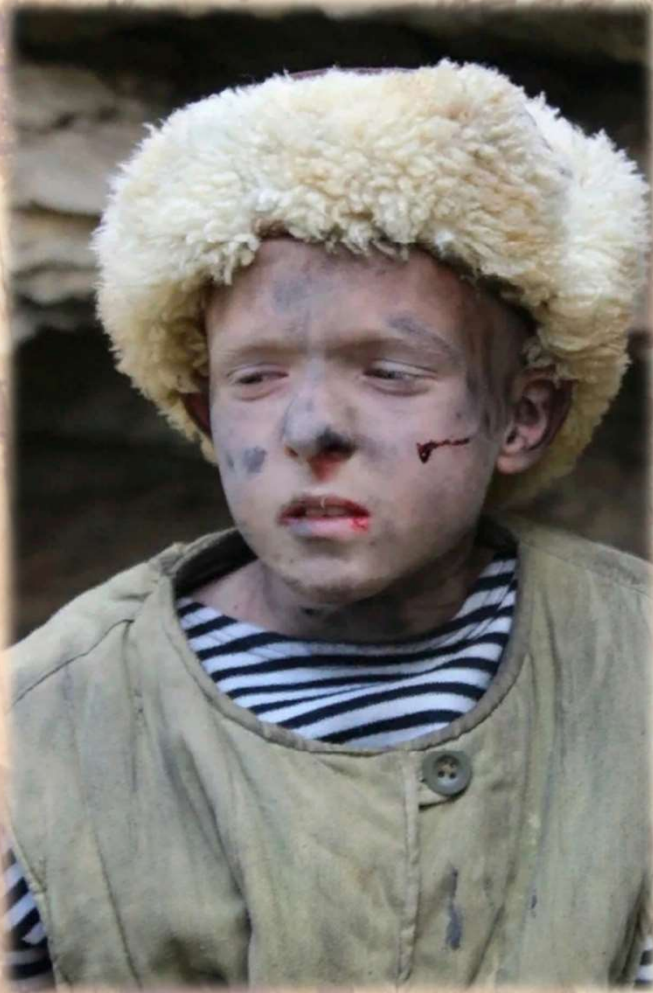
Миша выходит из каменоломен (кадр из фильма)