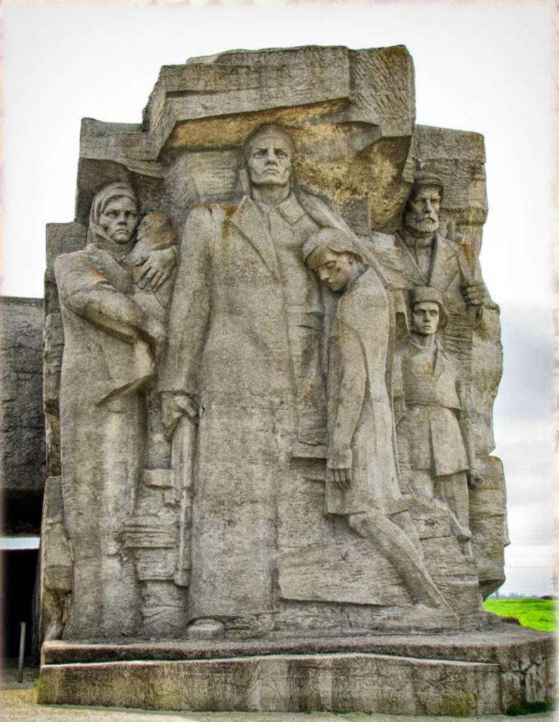
170 дней продолжалась героическая оборона «Керченского Бреста» - Аджимушкских каменоломен (с 16 мая по 31 октября 1942 г.)