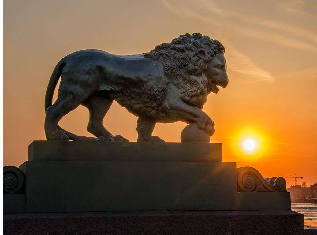
Иван Прокофьев Статуя льва в Санкт-Петербурге