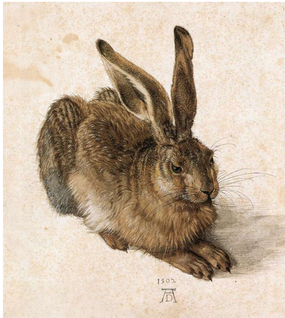
Альбрехт Дюрер «Заяц»