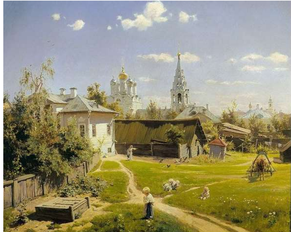
Василий Поленов «Московский дворик»