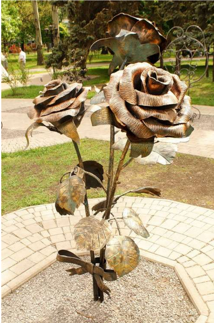
Кованные розы Донецка