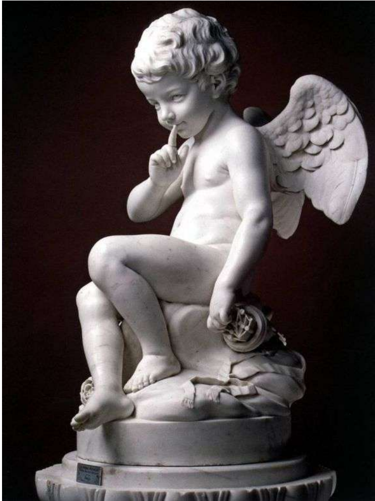
Этьен Морис Фальконе «Амур»