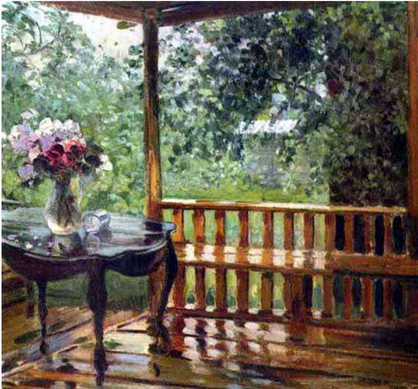
Александр Герасимов «После дождя»