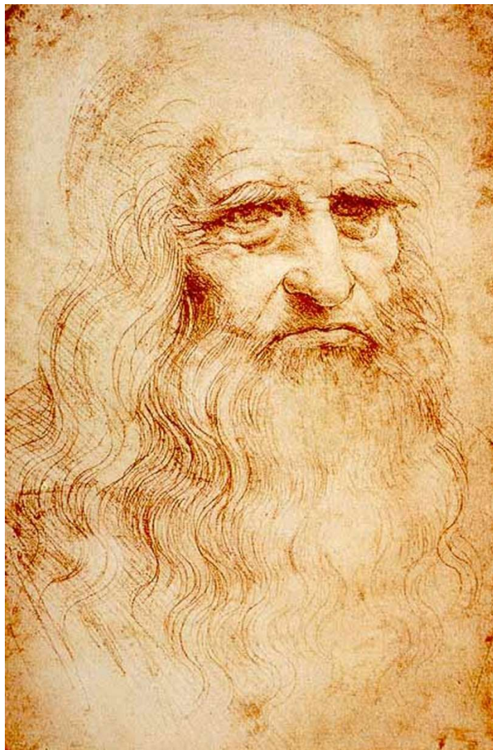
Леонардо да Винчи Автопортрет