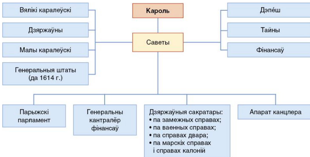
Дзяржаўныя органы ўлады ў Францыі ў перыяд абсалютызму