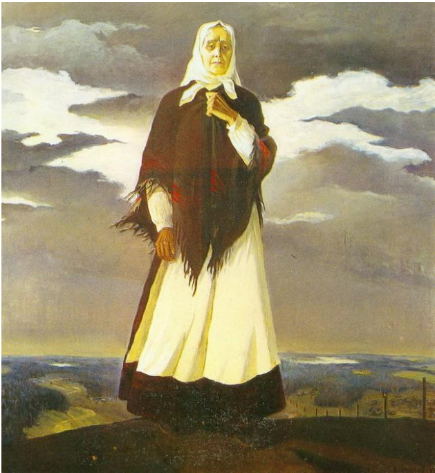
В.Ф. Шматаў “Маці”