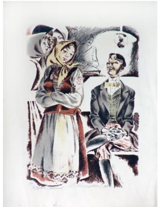
А.М. Кашкурэвіч Ілюстрацыя да твора