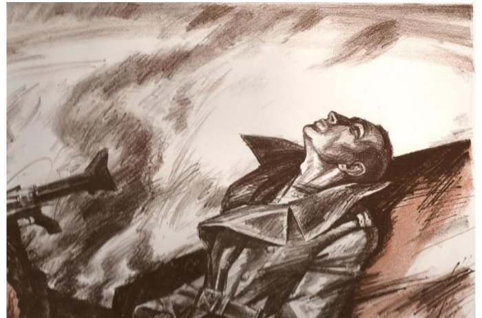
А.М. Кашкурэвіч Кампазіцыя “Песня жаўранка”