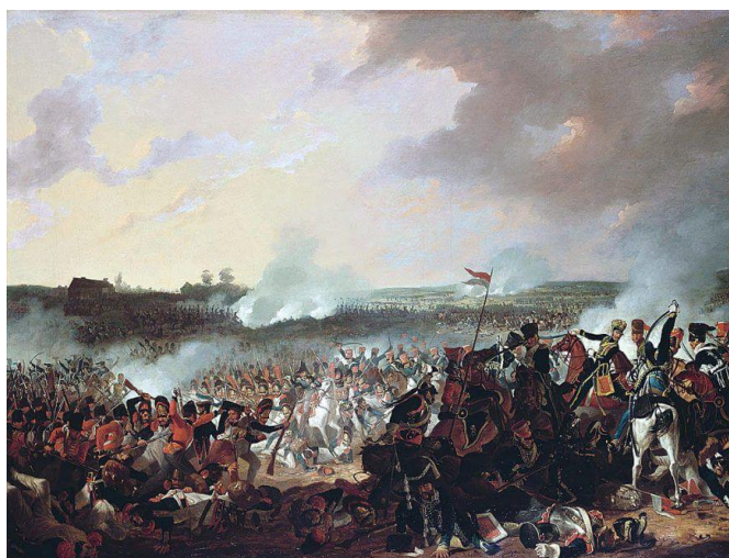
Дэніс Дайтан “Бітва пры Ватэрлоа”