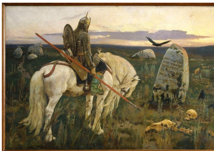
Віктар Васнячоў “Віцязь на раздарожжы”